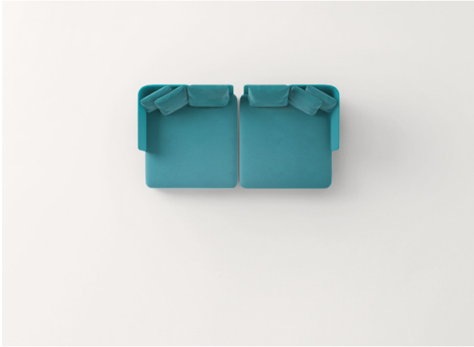
n° 2 B25M + B25SCS + n° 2 B25SCA + B25SCD